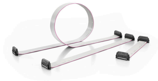
Three standard lengths (0.1 m, 0.2 m, and 0.5 m)