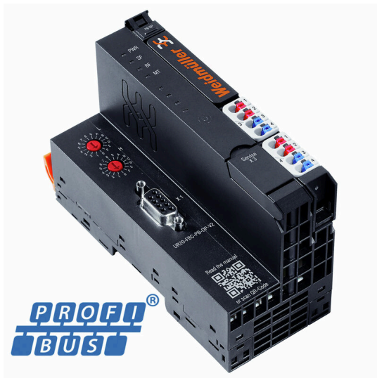
Imagen de producto, Similar a la ilustración