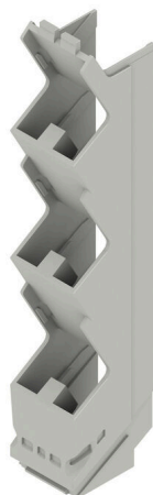
Imagen de producto