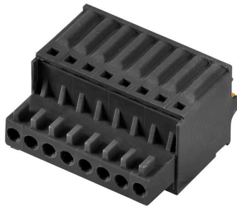
Similar a la ilustración