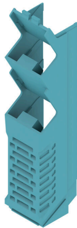
Imagen de producto