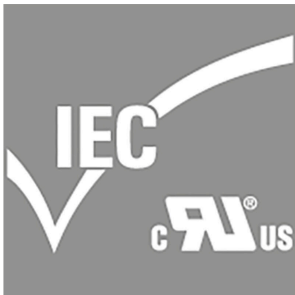
Compliant with existing standards