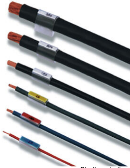
Similar a la ilustración