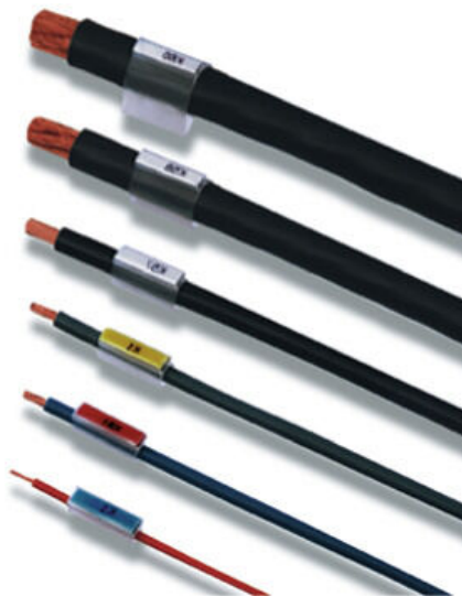
Similar a la ilustración