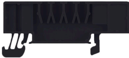
Imagen de producto