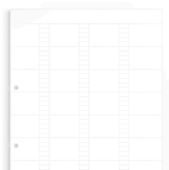
Similar a la ilustración