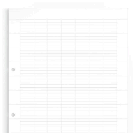
Similar a la ilustración