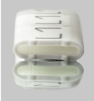
Similar a la ilustración