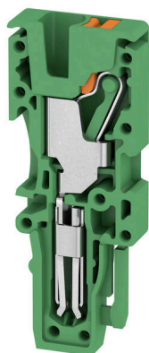
Imagen de producto