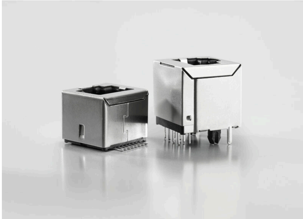
Suitable for all soldering processes SMT, THT or THR