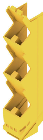
Imagen de producto