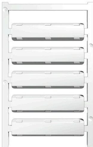
Similar a la ilustración