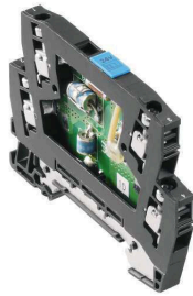
Similar a la ilustración