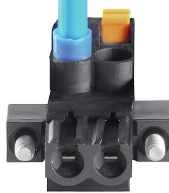
Wide clamping range Tool-free wire connection