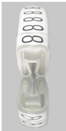
Similar a la ilustración