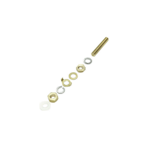
Erdungsbolzen zum Austausch als komplettes Bauteil in zwei Varianten, Messing und Edelstahl.