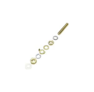
Erdungsbolzen zum Austausch als komplettes Bauteil in zwei Varianten, Messing und Edelstahl.