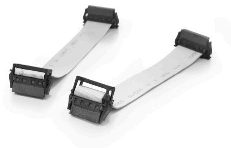
With optional strain relief