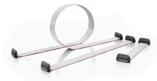
Three standard lengths (0.1 m, 0.2 m, and 0.5 m)