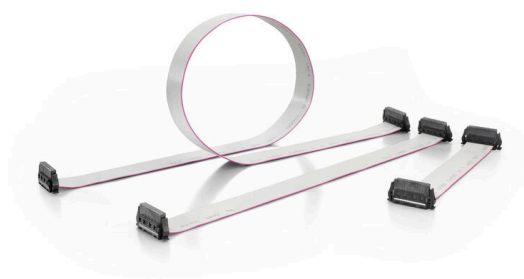
Three standard lengths (0.1 m, 0.2 m, and 0.5 m)