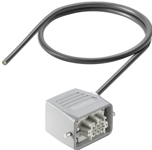
Product similar to the picture