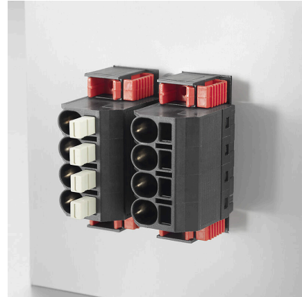
Installation ohne WerkzeugAbgangsrichtung: 90° und 180°