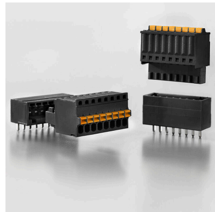
Flexibel einsetzbar Abgangsrichtung: 90° und 180°