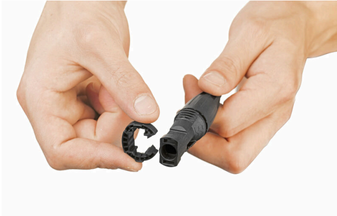
Locking clip to prevent unintentional opening