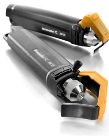
Odstraňovač pláště PVC kabelů