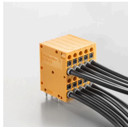
Compact design with 2 levels