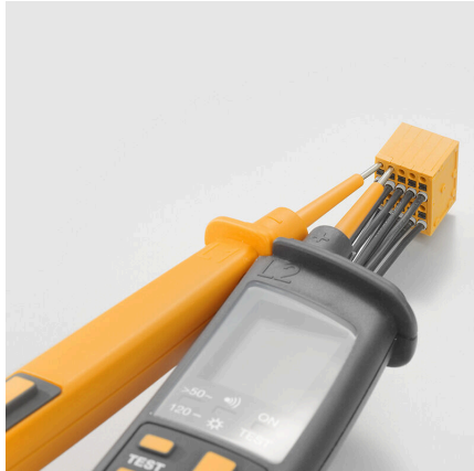
Maintenance through test tap