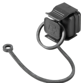
Na ochranu vašich zařízení před prachem a nečistotou.