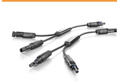
Y 电缆用于 PV 系统中多个组串的并联连接, 例如在逆变器前分线。 电缆拥有不同的连接变体