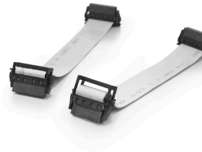
With optional strain relief