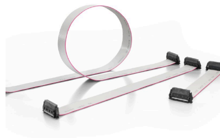
Three standard lengths (0.1 m, 0.2 m, and 0.5 m)