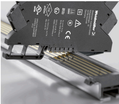
Power supply via the rail bus