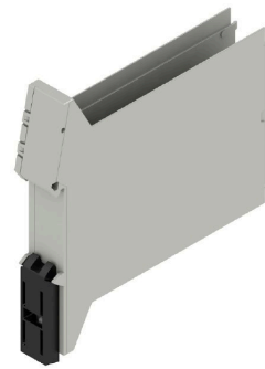
卡扣式底脚无切口的底座元件