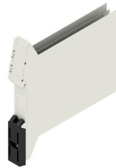
卡扣式底脚无切口的底座元件