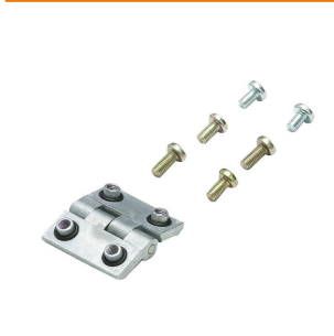
Klippon® K-系列, 附件